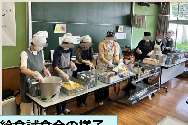
給食試食会の様子